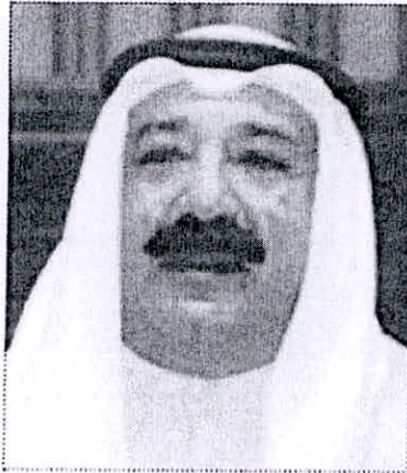
● الشيخ ناصر صباح الأحمد

ان تكون عند حسن ظن راعي الاحتفالية النائب الأول لرئيس مجلس الوزراء وزير الدفاع الشيخ ناصر صباح الأحمد، وان يكون الحفل لانقا برعايته وحضوره الكريم، لافتا الى ان اللجنة انتهت من جميع استعداداتها وتبقى فقط اللمسات الأخيرة، متوجها بشكره لكافة أعضاء اللجنة العليا المنظمة واللجان المنتهقة وفريق سواعد شبابية لواصلتهم العمل 24 ساعة حتى خلال العطلة الأسبوعية ولما بذلوه من جهود متواصلة خلال التجهيز لتلك الاحتفالية.