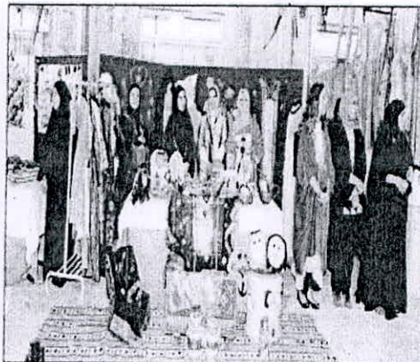
معرض الوسائل التعليمية