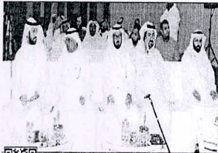
خاتبة من المشهور